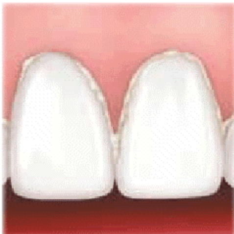
O tártaro ameaça a saúde da boca, tornando seu sorriso menos atraente.

Depois de formado, só o dentista pode retirar o tártaro dos dentes. O processo de retirada do tártaro, feita com instrumentos especiais, é conhecido como "raspagem"