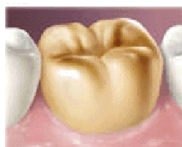
Coroa de ouro fundido