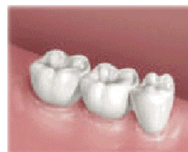
A ponte é cimentada na posição