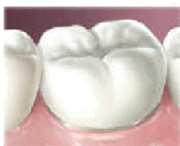
Porcelana fundida ao metal