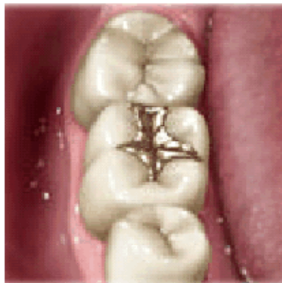
Restauração de ouro