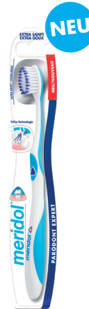
meridol® Parodont Expert extra sanft