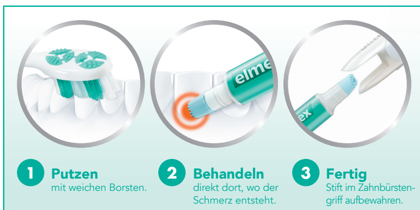
Abb. 1: Anwendung des Schmerzlinderungsstiftes

Der elmex® SENSITIVE PROFESSIONAL™ Schmerzlinderungsstift wurde für Patienten mit schmerzempfindlichen Zähnen entwickelt. Das Gel mit der klinisch geprüften Pro-Argin® Technologie zur sofortigen und anhaltenden Schmerzlinderung lässt sich auch unterwegs auf die Zähne auftragen (Abb. 1).