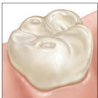
Molaire légèrement érodée