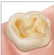
Molaire fortement érodée

Si l'érosion n'est pas prévenue à temps, des pertes importantes d'émail et une hypersensibilité des dents peuvent survenir. Dans les cas les plus graves, une restauration des dents affectées (ex.: couronnes ou couronnes partielles) peut s'avérer nécessaire.