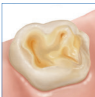
Schwer erosions- geschädigter Backenzahn

Wird Zahnerosion nicht rechtzeitig vorgebeugt, können schwerer Zahnschmelzverlust und Überempfindlichkeit der Zähne die Folge sein. In gravierenden Fällen können sogar Restaurationen der betroffenen Zähne (z. B. Teilkronen oder Kronen) nötig werden.